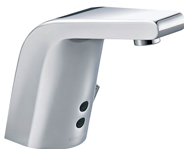
RADA INSIGHT 100

mit Mischung 1.1929.015 ohne Mischung 1.1929.017